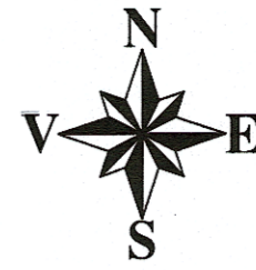
Schema dispunere planse