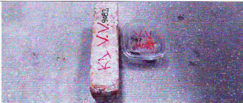
Probe de mortar și zidărie prelevate de la gara din Valea Viilor