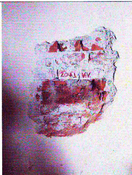
Zona 1 – ax F/5-6