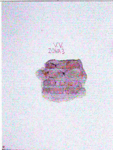
Zona 3 – ax G/7-8