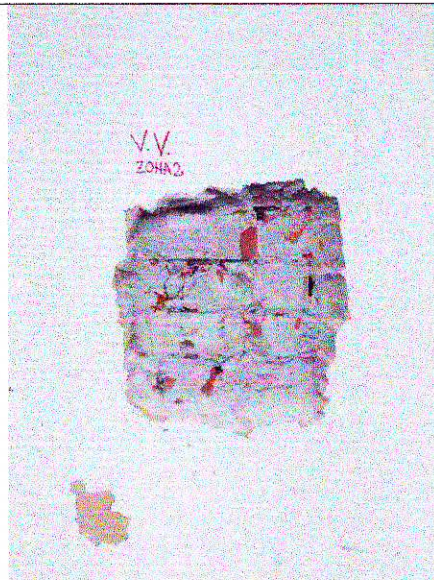
Zona 2 – ax F-G/2