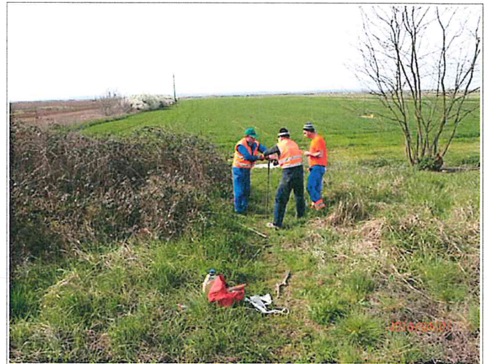
Foto nr.2-Executie foraj