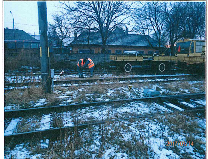
Foto nr.32- Executie foraj Statia Lugoj