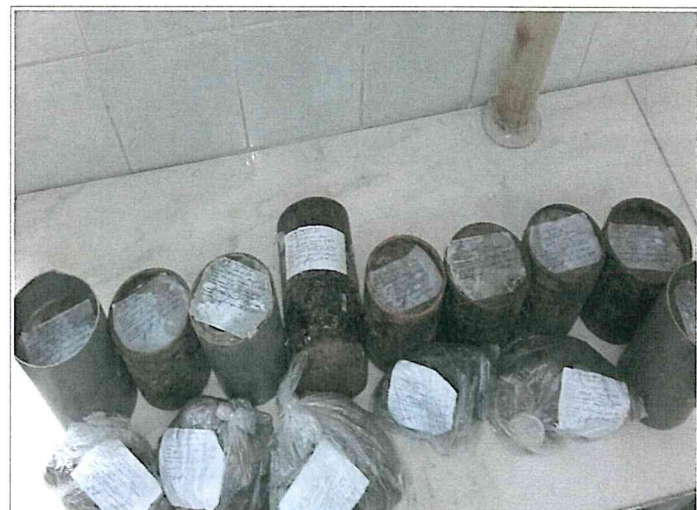
Foto nr.16- O parte din probe in laborator