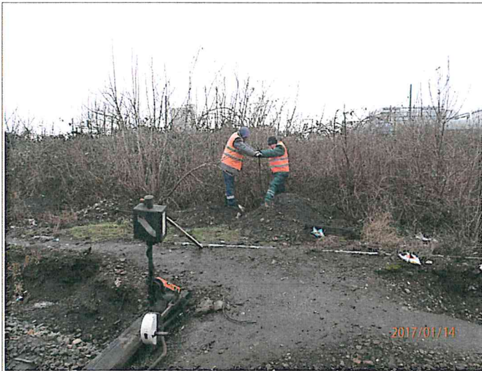
Foto nr.31-Executie foraj Statia Timisoara