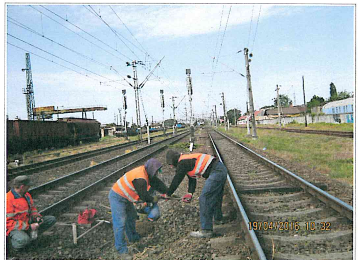
Foto nr.4- Executie foraj Statia Timisoara Nord