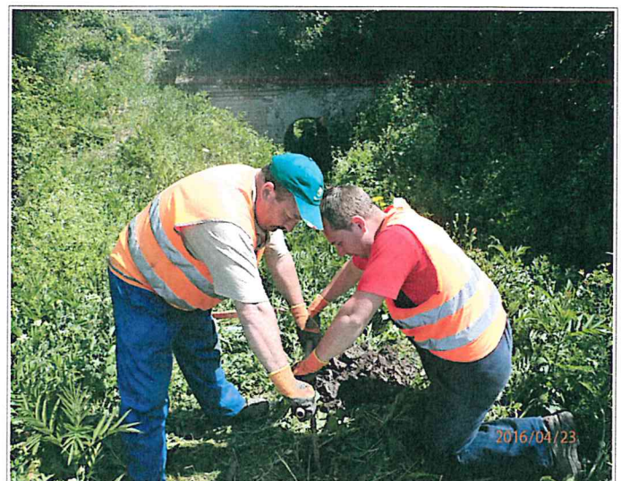
Foto nr.6- Executie foraj