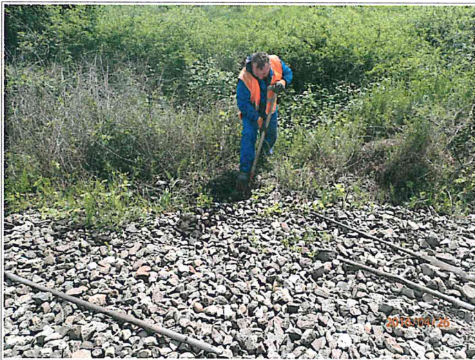
Foto nr.1-Executie sondaj