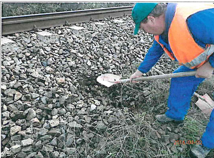
Foto nr.3-Executie in teren a unei dezveliri la cap traversa