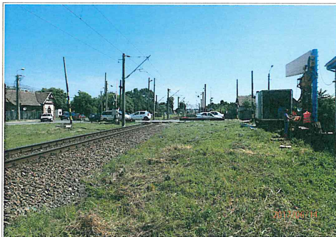
Foto nr.47-Zona km 571+048 - 571+070