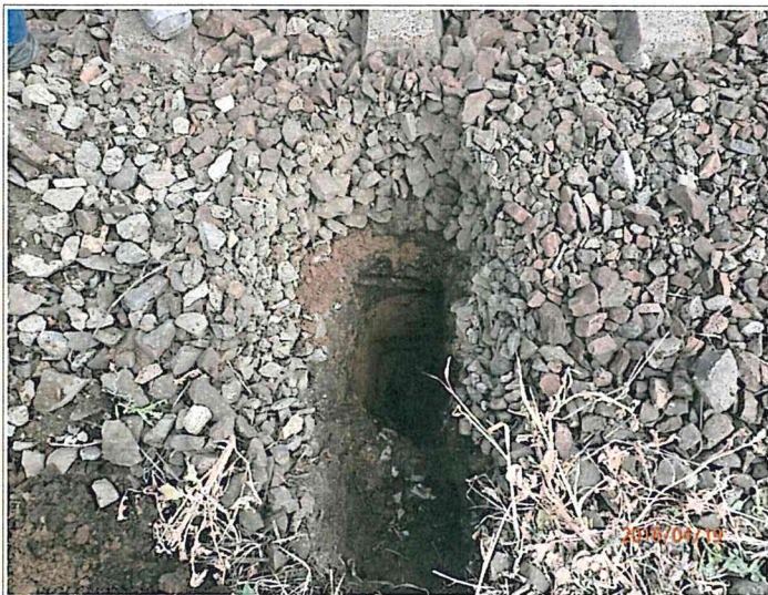
Foto nr.7-Dezvelire la cap traversa