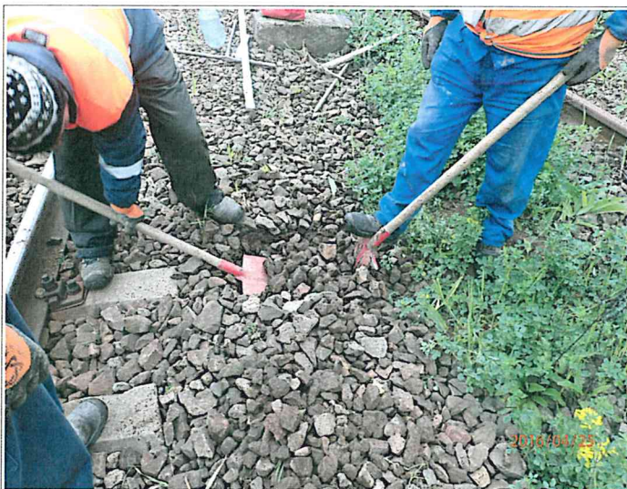
Foto nr.5-Executie dezvelire cap traversa