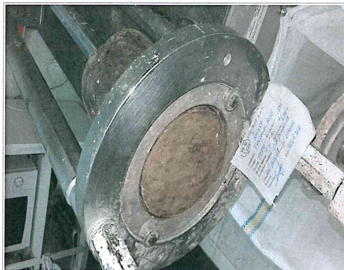
Foto nr.17- Proba investigata in laborator