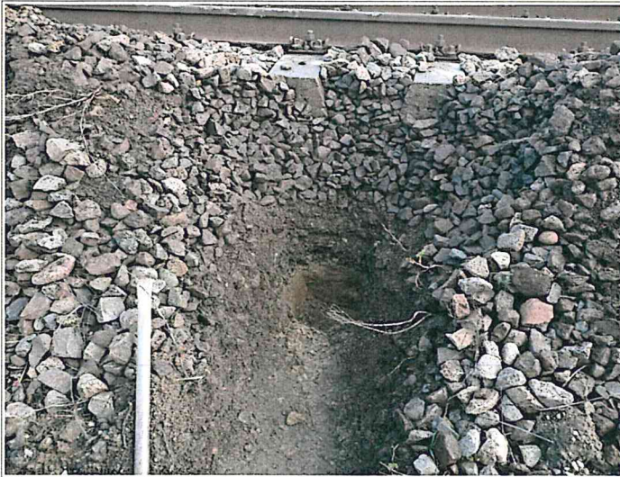
Foto nr.13-Dezvelire la cap de traversa