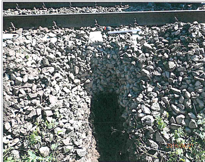
Foto nr.8- Dezvelire cap traversa