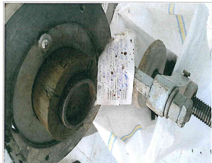
Foto nr.18- Proba investigata in laborator