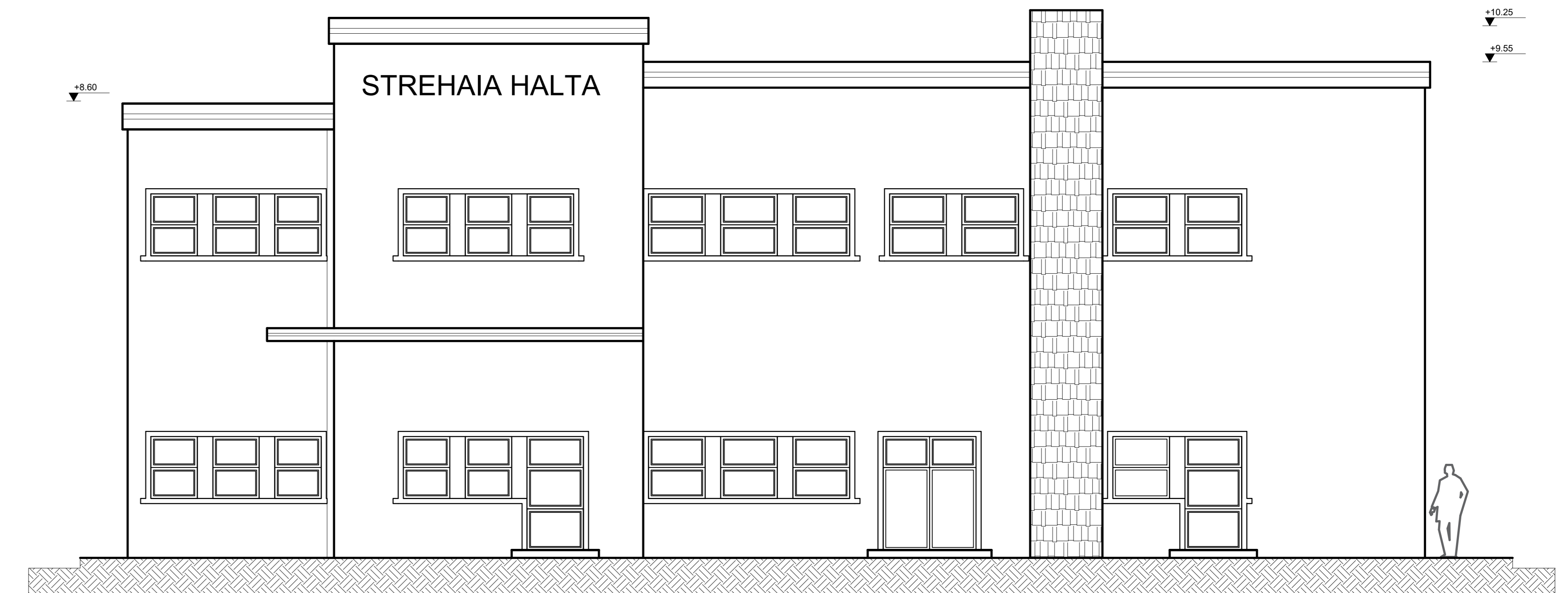
PROFIL TRANSVERSAL KM 312+365, HALTA STREHAIA KM 312+365 CROSS SECTION, STREHAIA STOPPING POINT